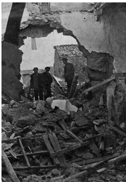
El Hospital del Servicio Sanitario Internacional, de Tarancón, después del bombardeo del 3 de diciembre de 1937. AMI, Albacete, n.º 6 (15-12-1937), p. 12.

En 1937 fueron atendidos en los centros de Tarancón 379 heridos, con un promedio diario de 63. 167