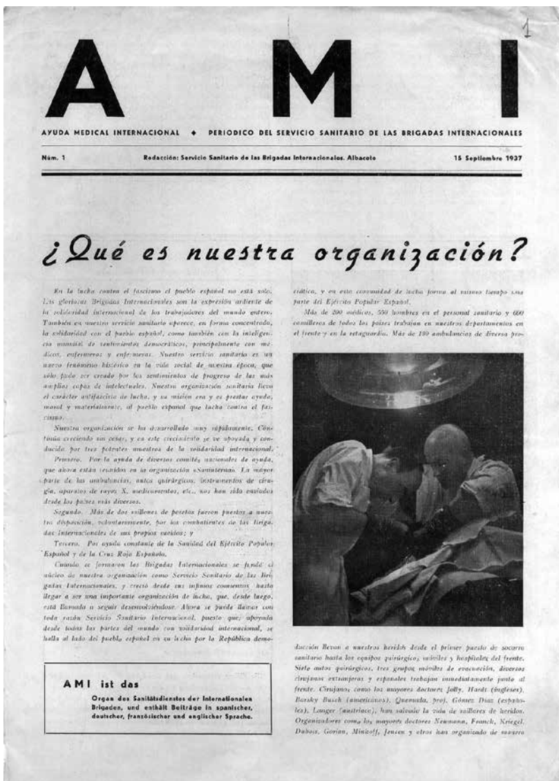
AMI, Albacete, n.º 1 (15-9-1937), p. 1. Archivo Estatal Ruso de Historia Socio-Político (RGASPI): http://sovdoc.rusarchives.ru/# (19-7-2017)

Es muy interesante también la publicación La Voz de la Sanidad de la XV División , cuyo primer número ve la luz el 27 de mayo de 1937, continuando hasta el 27 de enero de 1938. En cada uno de sus 25 números la revista ofrece una visión bastante real y profunda de los problemas de la