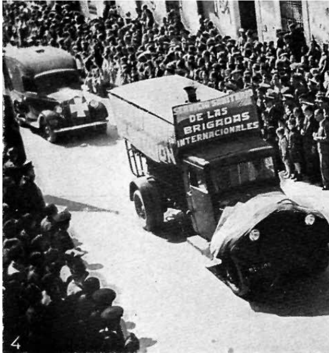
Servicio sanitario en un desfile miliar en Albacete (Octubre de 1937). En Un año de las Brigadas Internacionales , Madrid, Diana, 1937, p. 107.

nitarios de los Centros de Instrucción y Reserva de Sanidad destinados a las Secciones de Higiene y Desinfección de la Zona de Ejércitos” 156