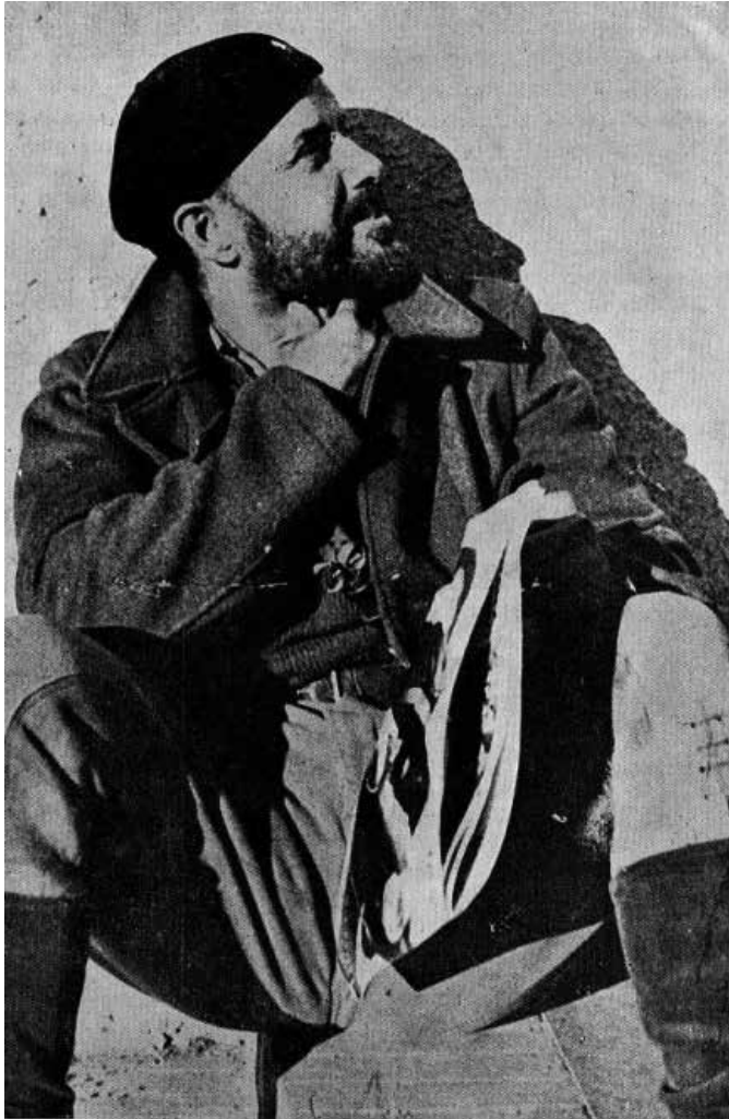
“Encerrados en el corazón de todos los oprimidos”, AMI, Albacete, nº 1 (15-9-1937), p. 6. Archivo Estatal Ruso de Historia Socio-Político (RGASPI) http://sovdoc.rusarchives.ru/# (19-7-2017)