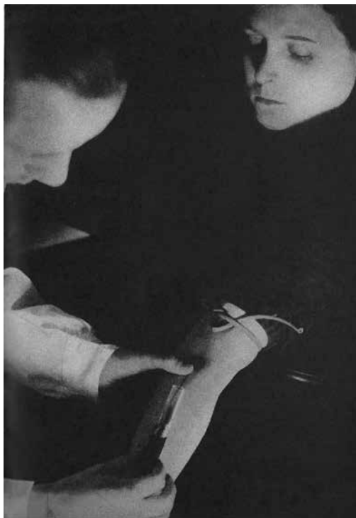
Fuente: R.B., "Their blood for Spain", Spain at war, n° 6 (Septiembre de 1938), p. 219.