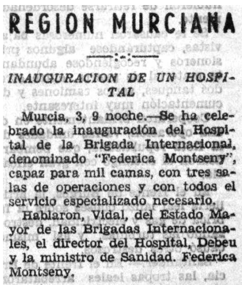
“Región murciana”, Diario de Almería, nº 7.081 (4-5-1937), p. 1.