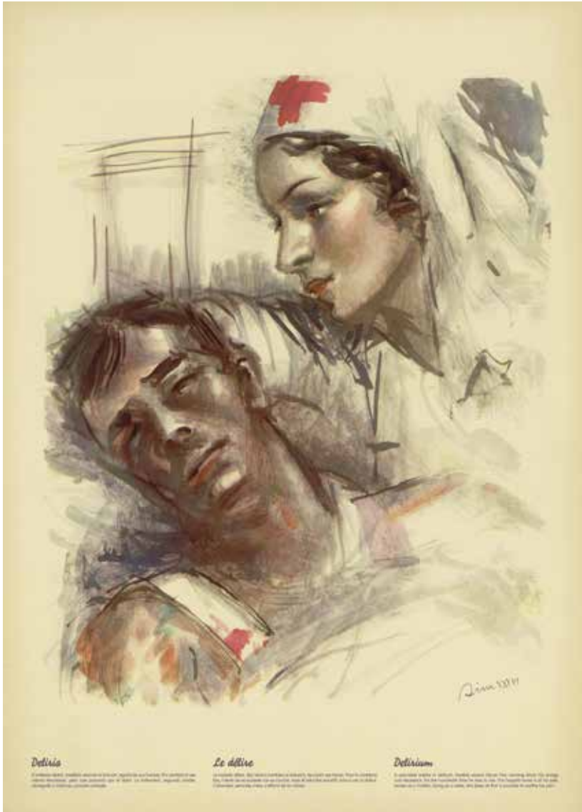
Fuente: SIM (José Luis Rey Vila), “Delirio”, Estampas de la Revolución Española. 19 de julio de 1936, Barcelona, CNT-FAI, 1936.

tor de varias publicaciones, entre ellas su tesis doctoral sobre “El aparato dental del hombre prehistórico y su comparación con el actual”. 260