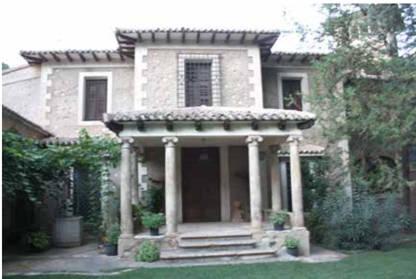
Hospital Cueva de la Potita