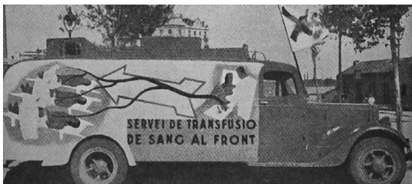
Fuente: R.B., "Their blood for Spain", Spain at war, n° 6 (Septiembre de 1938), p. 220.