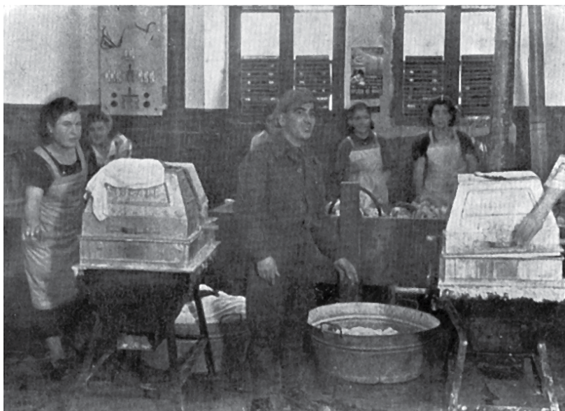
Lavandería de los hospitales en Albacete. AMI, Barcelona, n.º 7 (1-1-1938), p. 6.

La mayor parte de las tropas fueron vacunadas contra el tifus. 121