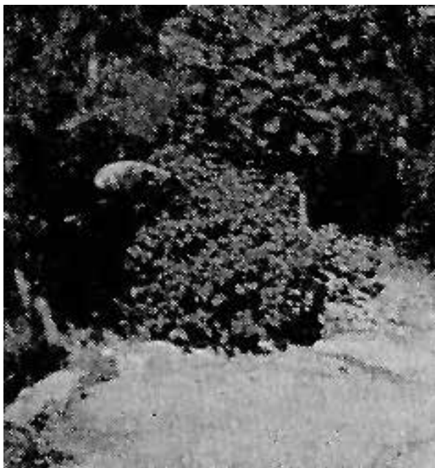
Un auto-chir camuflado. En La Voz de la Sanidad de la XV División, Madrid, nº 11 (7-9-1937), p. 6.