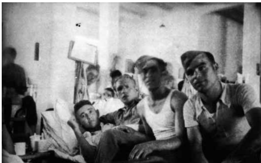
Brigadistas daneses en un hospital de España en 1938

ros, yugoslavos, montenegrinos, albaneses, letones, rusos, españoles, etc. Algo semejante pasó en Tarazona de la Mancha, con 6.302 habitantes en los años 30, donde se formó el Batallón Tschapaiev o de las 21 Naciones, de la XIII Brigada Internacional, donde habían alemanes, polacos, españoles, austríacos, suizos, palestinos, holandeses, checos, húngaros, suecos, daneses, yugoslavos, franceses, noruegos, italianos, luxemburgueses, ucranianos, belgas, rusos, griegos y brasileños.