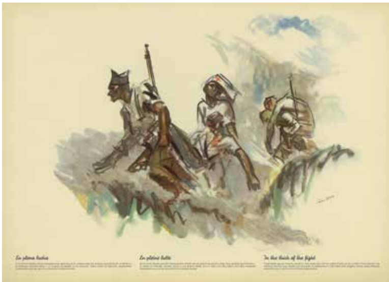
Fuente: SIM (José Luis Rey Vila), “En plena lucha”, Estampas de la Revolución Española . 19 de julio de 1936, S. I., CNT-FAI, 1936.

La Organización Sanitaria de cada Brigada era la misma que se ocupaba, durante la lucha, de una División. Con la transformación del Ejército en Divisiones, las organizaciones sanitarias de Brigada se convirtieron en organizaciones sanitarias de División. 138