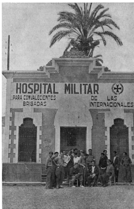
Hospital en Orihuela, AMI, Albacete, n.º 4 (15-11-1937), p. 4.