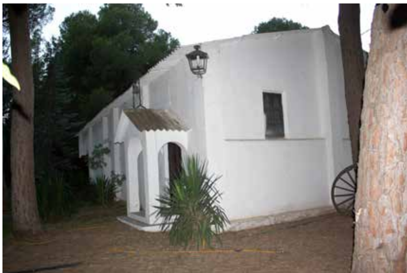
Pabellón de ocio construido durante la guerra en la Cueva de la Potita

Las Casas de Convalecencia estaban situadas en lugares de climas deliciosos y de ambiente apacible. De esta categoría eran los centros de Orihuela (con 300 camas) y Benicasim (con un departamento de 100 camas y diferentes villas veraniegas con un total de 400 camas para convalecientes).